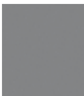
Aluminium Metallic (38P)